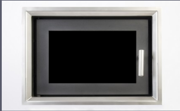
Heiztüre „Classic“ ( B 460 mm x H 350 mm )