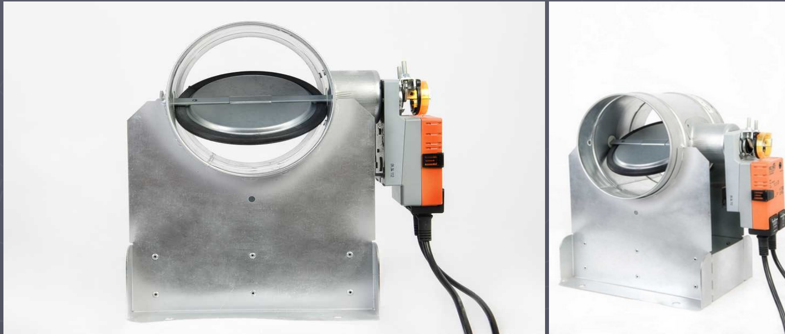
Stellmotor inkl. Halterung